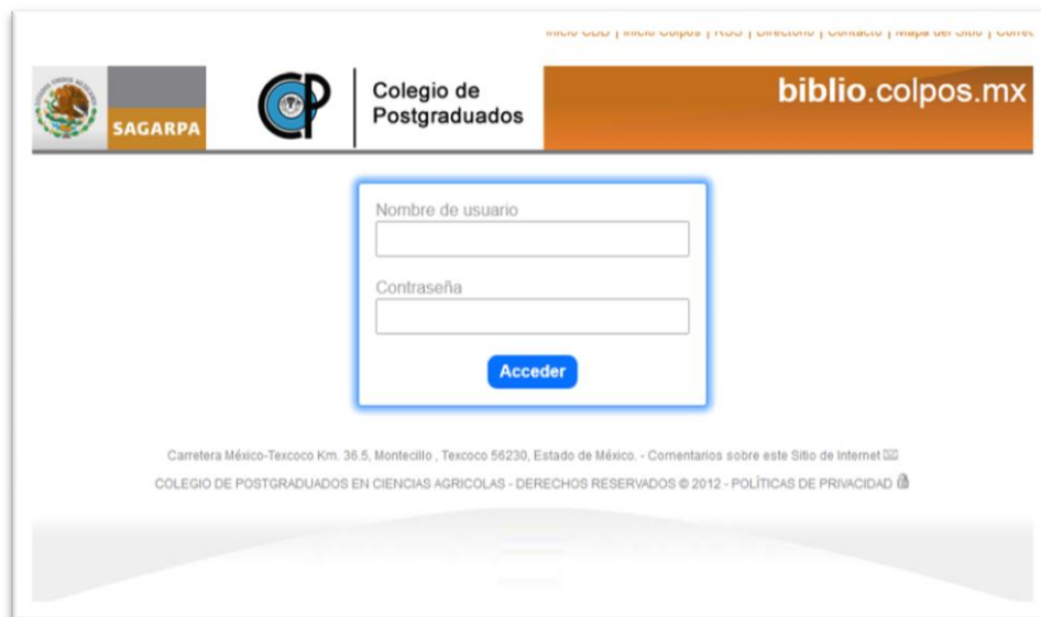
Figura 3. Solicitud de usuario y contraseña para ingresar a los recursos digitales de Información científica y tecnológica en el Colegio de Postgraduados.

Una vez que haya ingresado sus datos correctamente y sea aceptado por el servicio, no se le volverá a solicitar cuando quiera ingresar a otras bases de datos, revistas o libros electrónicos digitales mientras mantenga abierto el explorador con el que navegue en Internet y su computadora.