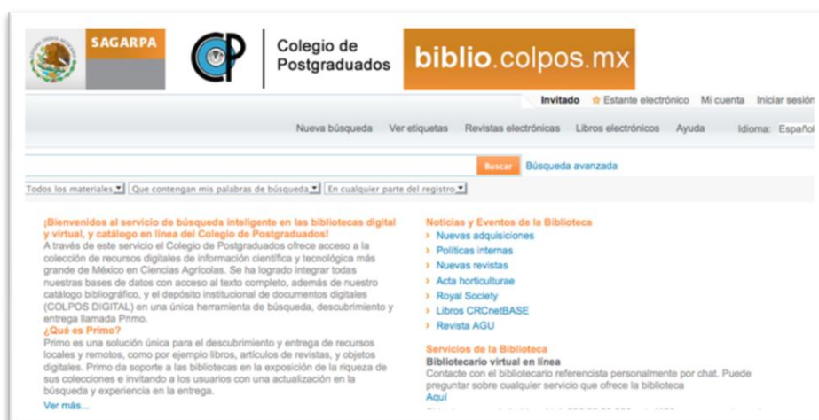
Figura 2. Servicio de búsqueda Integrada Primo Colpos.

O navegando por el servicio de búsqueda integrada PRIMO COLPOS (véase la Figura 2).